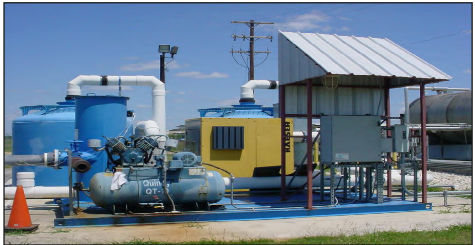
Un sistema de extracción de vapor en la tierra usado en la antigua base aérea Kelly.