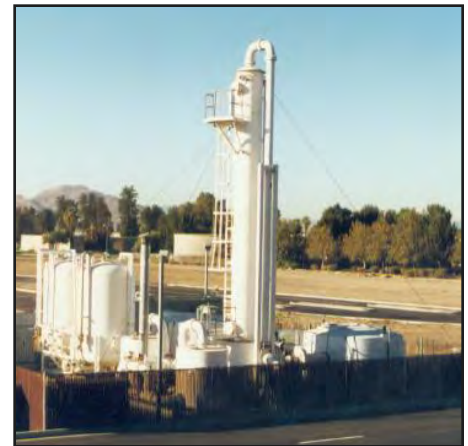
Este sistema de bombeo y tratamiento fue utilizado en la antigua base aérea Norton en el estado de California.